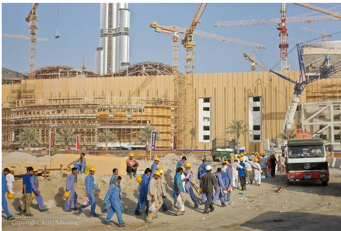
Photographie - Fritz Mueller Visuals, « Dubaï », copyright Fritz Mueller, 2015.